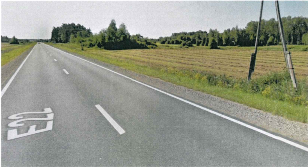
Zeme kadastra Nr. 90740040026