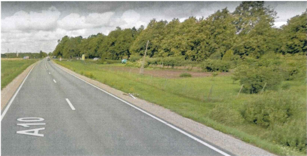
Zeme kadastra Nr.90740080080