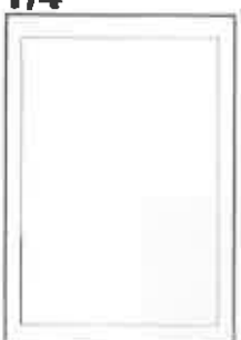
100x148+5 ar apgr. malām