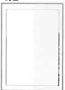
100x297+5 ar apgr. malām