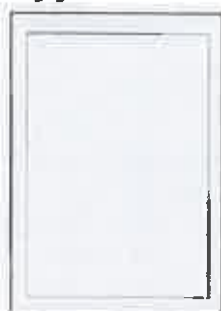
200x297+5 ar apgr. malām