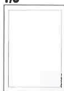
100x74+5 ar apgr. malām

Maketus, lūdzu, sūtīt uz e-pastu: vivita.ziedina@medijunams.lv vai likt uz FTP servera: ftp.medijunams.lv (lietotājs: reklama, parole: sheiY8)