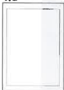
66x297+5 ar apgr. malām