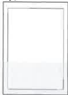
200x100+5 ar apgr. malām