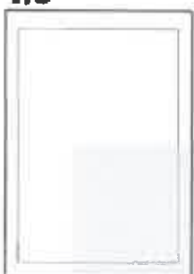
130x148+5 ar apgr. malām