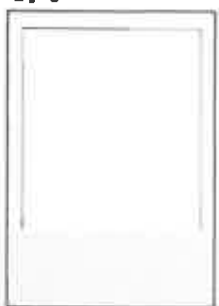
200x74+5 ar apgr. malām