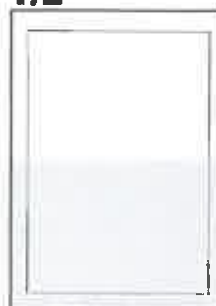
200x148+5 ar apgr. malām