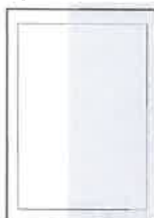
130x297+5 ar apgr. malām